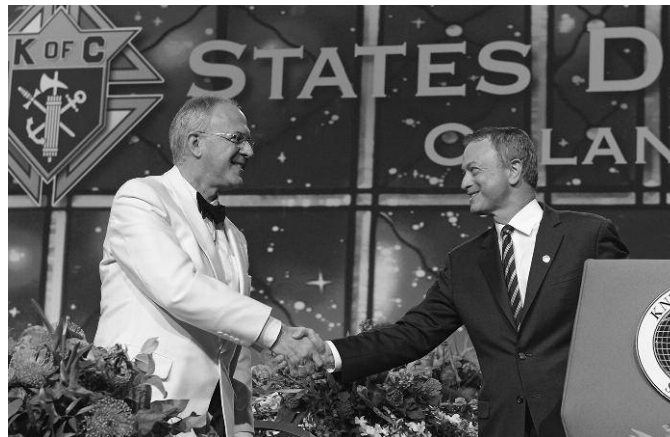
El Caballero Supremo Anderson saludando a Gary Sinise.

En un discurso muy personal y emotivo, Sinise recordó haber crecido durante los últimos años de la impopular guerra de Vietnam y que no prestaba atención al sacrificio de aquellos que luchaban. Hablando con