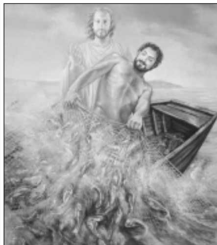
Pintura que muestra a San Pedro recogiendo una gran pesca, con la imagen de Cristo al fondo.

Para conseguir la meta de ofrecer la membresía en los Caballeros de Colón a todos los católicos idóneos, el