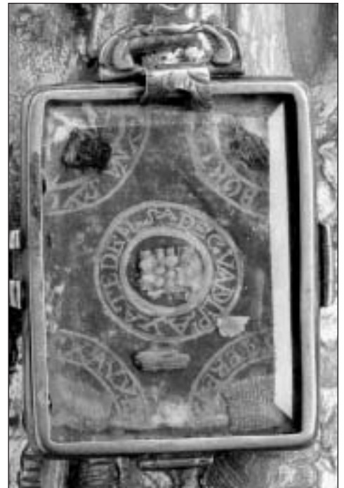
El relicario con la reliquia de la tilma de San Juan Diego que recorrerá por los Estados Unidos.

"Recemos por que esta peregrinación de la tilma inspire a los Caballeros de Colón"