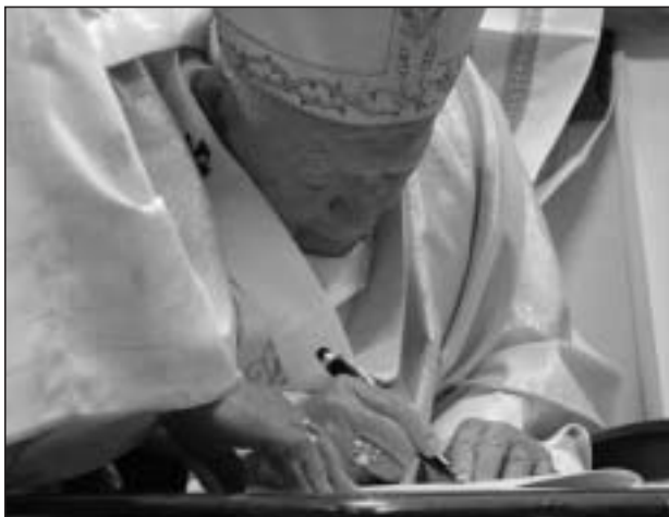
El Papa Juan Pablo II emitió el Jueves Santo la encíclica " Ecclesia de Eucharistia ", que describe la Eucaristía y su relación con la Iglesia.

El Caballero Supremo, Carl A. Anderson, dijo que en los próximos meses la Orden de Caballeros de Colón dará a conocer y publicará la encíclica " Ecclesia de Eucharistia " a través de varios medios. El primer acto para poner en relieve la encíclica será el II Congreso Eucarístico de Caballeros de Colón que se celebrará en la Basílica del Santuario Nacional de la Inmaculada Concepción, en Washington, D.C., el 7 y 8 de agosto del 2003.