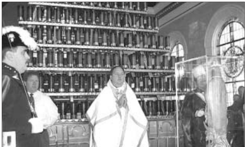
Los Caballeros de Colón del Cuarto Grado montaron Guardia de Honor durante la estadía de la reliquia de la Tilma de San Juan Diego en LaCrosse, Wisconsin.

zado por el Apostolado de las Santas Reliquias (con sus siglas en inglés AHR), que tiene sus oficinas en Los Ángeles, California, terminará el 5 de diciembre de 2003, en la Catedral de San Patricio, de la ciudad de Nueva York. Al finalizar el recorrido, la reliquia permanecerá en un altar de la nueva Catedral de Nuestra Señora de los Ángeles, en Los Ángeles, California. La Arquidiócesis de Los Ángeles ha conservado la reliquia desde 1941, cuando se recibió como un regalo del arzobispo de la Ciudad de México.