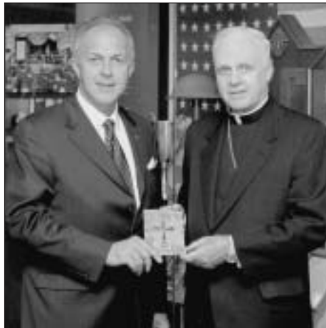
El Arzobispo Edwing F. O'Brien recibió del Caballero Supremo, Carl A. Anderson, un ejemplar del libro de oraciones de Caballeros de Colón

"La tarde del martes 8 de julio del 2003, enviamos un correo electrónico a nuestros capellanes en servicio activo anunciándoles la disponibilidad del libro de oraciones", dijo el Arzobispo O'Brien. "Para la mañana siguiente habíamos recibido peticiones de más de 50 sacerdotes por más de 25,000 libros de oraciones". El libro de oraciones tuvo