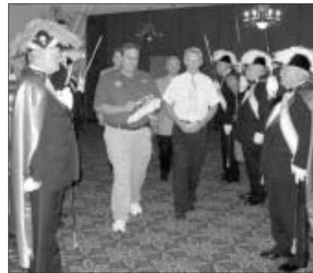
Miembros del Consejo 3540 de Lansing, Illinois, llevaron la Rosa de Plata en procesión en una ceremonia que celebraron a principios de este año.

da la Rosa de Plata de un estado a otro. La Rosa de Plata representa las rosas milagrosas que Nuestra Señora de Guadalupe le presentó a San Juan Diego, durante sus apariciones en las afueras de la Ciudad de México en 1531. La Rosa de Plata también es un símbolo del movimiento Pro-Vida, y Nuestra Señora de Guadalupe es la patrona de la causa por la vida.