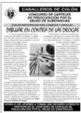
Guía del Concurso de Carteles #4112-S

Jóvenes de 8 a 14 años pueden participar en el Concurso de Carteles de Preocupación por el Abuso de Sustancias. Los carteles participantes pueden ganar reconocimientos a nivel local, de distrito, de estado e internacionalmente.