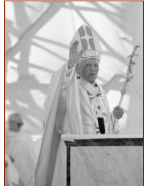
El Papa Juan Pablo II saludó a los Caballeros de Colón y a los fieles reunidos en el Hipódromo Aqueducto de Nueva York, el 6 de octubre de 1995, para la Misa Papal copatrocinada por la Orden y la Diócesis de Brooklyn, Nueva York.

La Orden financia en el Vaticano, una conferencia internacional convocada por el Papa sobre "Las Raíces Cristianas de las Naciones Europeas". Los Caballeros de Colón también imprimimos las actas de la