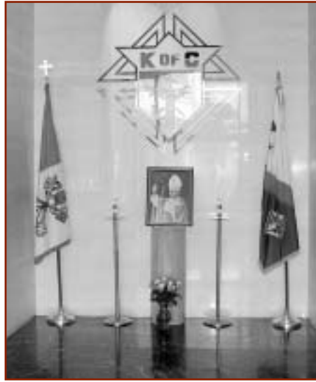
Un conmemorativo al Papa Juan Pablo II, en la entrada principal de las oficinas del Consejo Supremo, en New Haven, Connecticut.

líderes religiosos de todo el mundo a reunirse con él, como resultado de los ataques terroristas del 11 de septiembre de 2001. Más tarde, los Caballeros de Colón recibimos la