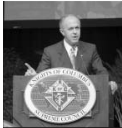
El Caballero Supremo, Carl A. Anderson informando en la Convención Suprema.

Los Caballeros de Colón también logramos un número récord de consejos al final del año fraternal. Al 30 de junio de 2005, habían 12,767 consejos activos. El año fraternal 2003-2004 terminó con 12,480 consejos. Los nuevos consejos fueron 285 y se reinstituyeron 8 consejos. También se funcionaron 6 consejos del año fraternal 2003-2004 para obtener un aumento neto de 287 consejos.