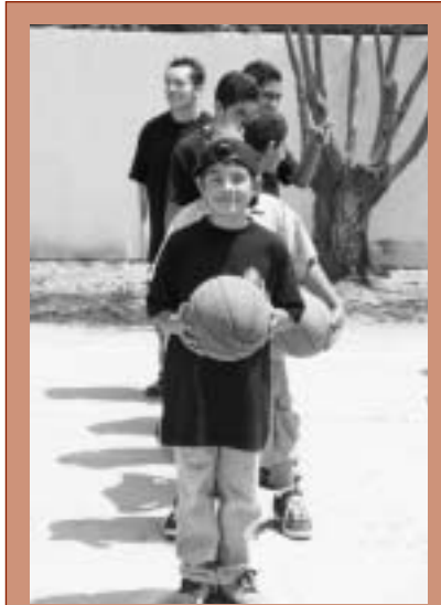
Ponerse en fila para participar en el Torneo Internacional de los Caballeros de Colón

Para patrocinar el torneo, todo lo que su consejo necesita es el Juego de Materiales del Torneo (#FT-KIT-S), unos cuantos balones, una cancha de baloncesto y un grupo de jóvenes. Este programa es una magnífica forma de llegar al público y promover nuestra Orden, al mismo tiempo que proveemos a los jóvenes buenas actividades, en las que pueden ganarse premios a nivel local, de estado e internacional.