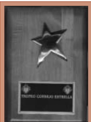
Premio Consejo Estrella