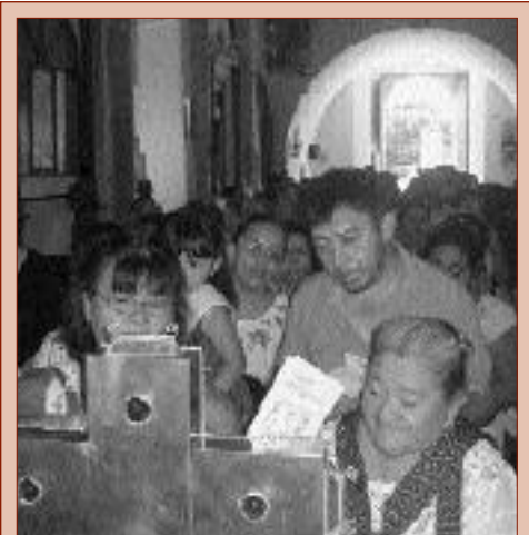
Los fieles veneraron las reliquias de los seis santos mexicanos que fueron Caballeros de Colón, durante la escala del relicario en Campeche, México. La visita fue organizada por el Consejo San Francisco de Campeche #11770, de Campeche, México. El relicario con las reliquias de los Santos Mártires comenzó en marzo el recorrido de peregrinación en los Estados Unidos.