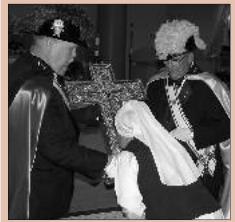
Una hermana religiosa besa el relicario de los santos mexicanos Caballeros de Colón, durante la peregrinación de las reliquias en Peoria, Illinois.