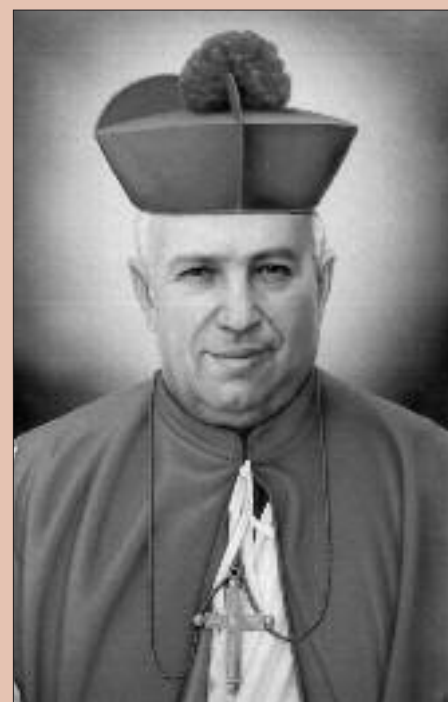
Obispo Rafael Guízar Valencia

Durante la resistencia se disfrazó de vendedor de bábulos, para continuar su labor como sacerdote. En 1915, cuando el gobierno mexicano ordenó su muerte, y que se le ejecu-