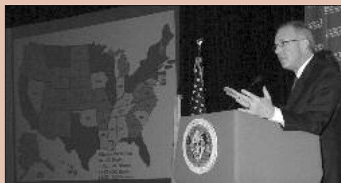
El Caballero Supremo, Carl A. Anderson, expuso un mapa de los Estados Unidos con el crecimiento de la Iglesia y el de los Caballeros de Colón.

"El Santo Padre, nuestros obispos y nuestros sacerdotes saben que en los Caballeros de Colón siempre tendrán la ayuda económica y material