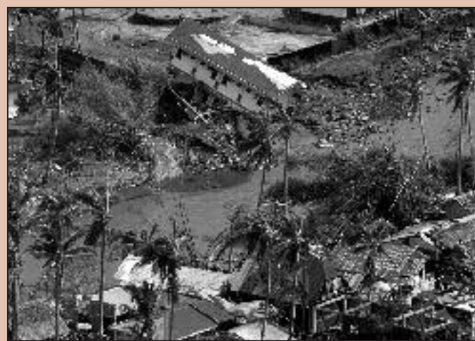
Un edificio fue removido de sus cimientos y se ve las casas destruidas por el Tifón Durian que golpeó el sudeste de Manila, el sábado 2 de diciembre. Los Caballeros de Colón han enviado $50,000 dólares de ayuda a Las Filipinas y han establecido un Fondo de Ayuda para el Tifón Durian.

ción de los Caballeros de Colón expresa nuestra solidaridad, en estos tiempos de necesidad. Estoy seguro que los Caballeros de Colón de toda la Orden incrementarán sus contribuciones para esta noble causa".