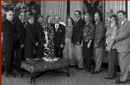
El Secretario Supremo, Donald R. Kohoe, (al centro) con los grandes caballeros, diputados de distrito ganadores y sus esposas.

L os ganadores del viaje a New Haven para grandes caballeros y diputados de distrito del año fraternal 2007-2008 recibieron un trato de "estrellas", en las oficinas del Consejo Supremo, y se reunieron con funcionarios de nuestra Orden, visitaron el Museo de Caballeros de Colón, asistieron a una misa en la Iglesia de Santa María, comieron en algunos de los mejores restaurantes de New Haven y recorrieron la ciudad. El sorteo de este incentivo estuvo abierto a los diputados de distrito que lograron el nivel de