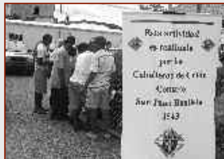
Todos los últimos sábado de cada mes, un nutrido grupo de Caballeros y sus esposas del Consejo 1543 de San Juan, Puerto Rico, llevan comida, ropa y la mano amiga a los deambulantes del sector Cantera en Hato Rey.

He aquí algunos puntos para reclutar voluntarios y las estrategias que debe usar cuando invite a personas a donar su tiempo.