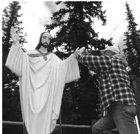
Un miembro del Consejo #1328 reemplazó la mano de la estatua cuando se rompió el pasado invierno.