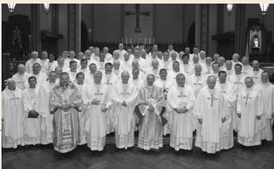
Se realizó la primera reunión de capellanes de estado en New Haven y asistieron los capellanes de 58 jurisdicciones, incluyendo cinco obispos.

El Caballero Supremo, Carl Anderson, dio un discurso en la Conferencia Anual Legatus de 2011, que se celebró del 3 al 5 de febrero, en la necesidad de demostrar un auténtico testimonio de lo que significa ser un seguidor de Cristo.