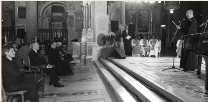
El Caballero Supremo, Carl Anderson, y el alcalde de Roma, Giovanni Alemanno, escuchan las palabras de agradecimiento del Cardenal Bertone por las obras de caridad de los Caballeros de Colón en Roma.

El concierto se celebró en la Iglesia de Santa María en Aracoeli, adyacente al Campidoglio, y estuvo a cargo del Coro Góspel de la Iglesia de Santo Tomás Moro de Washington, D.C., en honor de la colocación de la primera piedra. La plaza fue dedicada a Caballeros de Colón por sus obras caritativas en favor del pueblo de Roma.