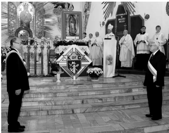
Los miembros del Consejo Pope John Paul II #14023 de Starachowice, Polonia, hacen guardia de honor a la imagen de Nuestra Señora de Guadalupe durante un servicio de oraciones.

Se estima que desde principios de abril, más de 150.000 personas participaron en los programas de oración Mariana en Polonia.