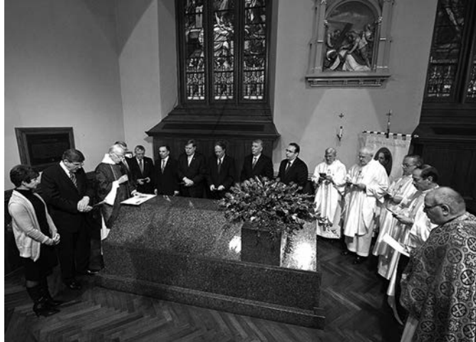
Inmediatamente después de la Misa, los asistentes se reunieron en el sarcófago del Padre McGivney, que está en la parte posterior de la iglesia, para rezar por su canonización.

En los primeros años, los Caballeros de Colón experimentaron obstáculos de crecimiento que fueron superados "porque Dios quiso que esta obra