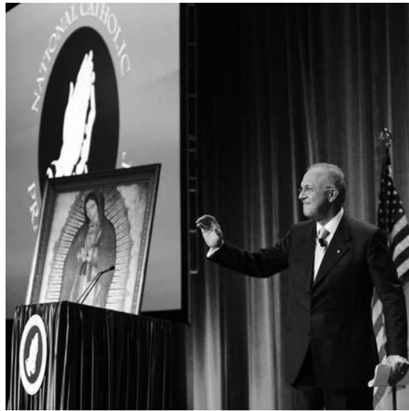
El Caballero Supremo, Carl Anderson, dio un discurso sobre la libertad religiosa durante el 8º Desayuno Anual Nacional de Oración Católica.

Por lo tanto, es tiempo de escoger, escoger si como católicos vamos a permanecer unidos para mantener abiertas las puertas de la libertad religiosa. Si lo hacemos, estaremos haciendo posible el próximo gran despertar en