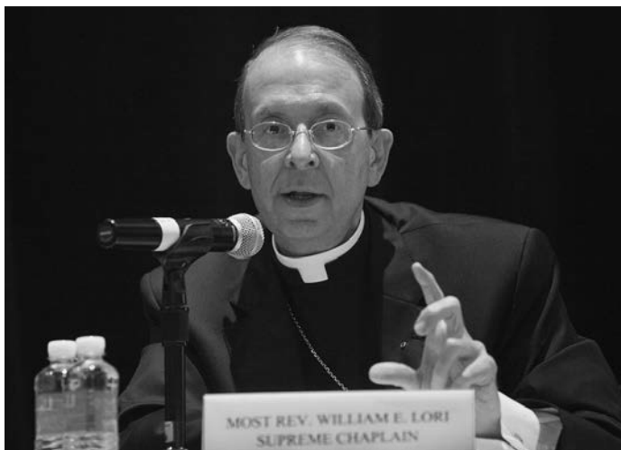
El Capellán Supremo se dirigió a los capellanes reunidos.

La historia detallada e ilustrada del historiador Jean Meyer de la Guerra Cristera, relata la importante lucha de principios del siglo XX, que aún en gran parte es desconocida, en la que los católicos mexicanos contendieron contra las represivas leyes antirreligiosas dirigidas hacia la Iglesia católica. Los Caballeros de Colón comisionaron la edición en inglés de este libro, y el Caballero Supremo escribió su prólogo. “ La Cristiada: The Mexican People's War for Religious Liberty ” ( La Cristiada: la Guerra del Pueblo Mexicano por la Libertad Religiosa ), se puede adquirir en todo el país, en las librerías y en el Internet.