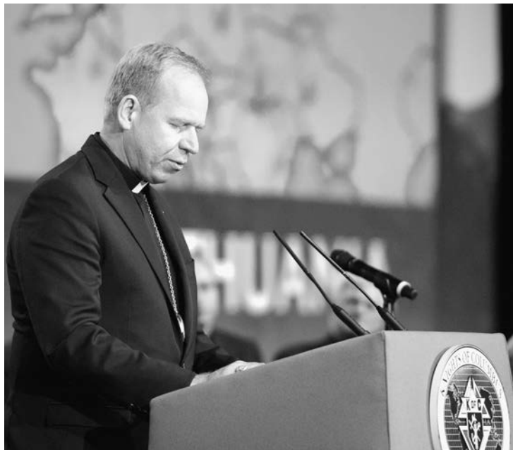
Su Excelencia Gintaras Grušas, arzobispo de Vilnius, Lituania, dio un discurso en la Sesión de Negocios del miércoles de la 131ª Convención Suprema.

En la Convención Internacional de este año se unieron Ucrania y Lituania a la lista de casi una docena de países en los que está activa la organización y son el segundo y tercer país en Europa Central y del Este con Caballeros activos. Los Caballeros de Colón llegaron a Polonia en 2006.