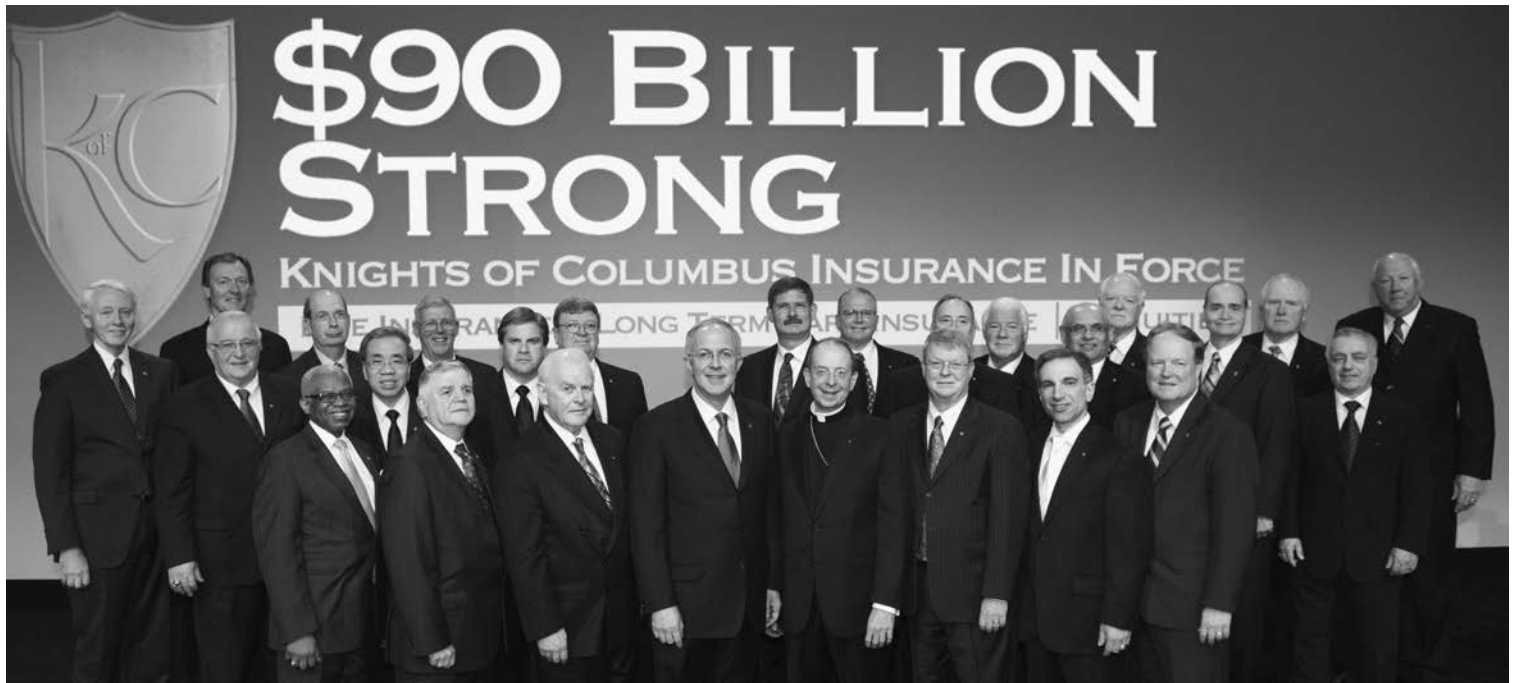
La Junta de Directores en la clausura de la sesión de negocios.