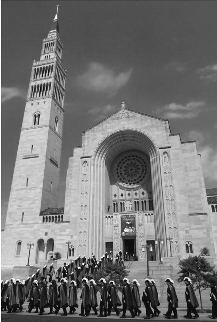
La Guardia de Honor estuvo alrededor del Santuario Nacional para la procesión de entrada, fue parte de la peregrinación del Año de la Fe en que también se celebró el 50° aniversario del carillón de la Torre de los Caballeros.