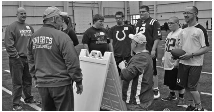
Atletas de las Olimpiadas Especiales escuchando las instrucciones para uno de los ejercicios.