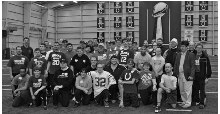
Participantes y voluntarios posaron juntos.