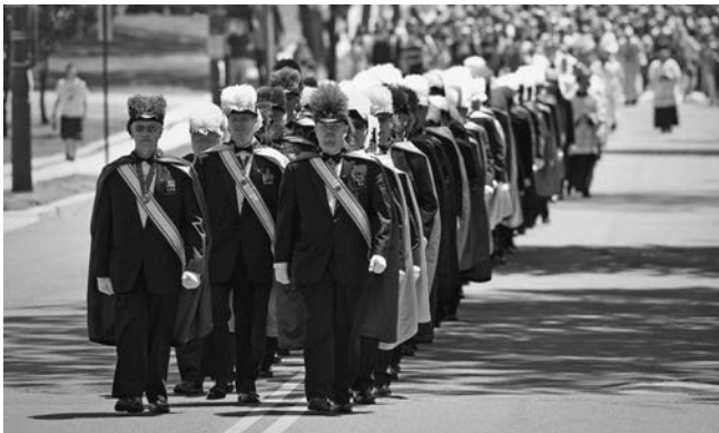
Caballeros del Cuarto Grado encabezaron la procesión desde la Basílica del Santuario Nacional de la Inmaculada Concepción al concluir la misa, hacia el nuevo dedicado Santuario Nacional San Juan Pablo II.