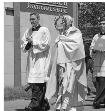
El cardenal Wuerl bendijo a la muchedumbre con la reliquia de san Juan Pablo II.