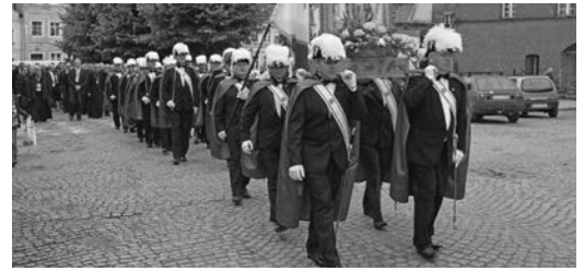
Los Caballeros del Cuarto Grado fueron en procesión por el pueblo con el cuadro de Nuestra Señora de Guadalupe. El cuadro se colocó en la capilla del castillo para adoración durante la convención.

En su discurso a los Caballeros polacos, el Caballero Supremo expresó su alegría por el desarrollo de la Orden en Polonia y los exhortó a redoblar sus esfuerzos para el crecimiento de la membresía y los programas. Explicó que los Caballeros de Colón tienen la obligación de ser custodios del legado de san Juan Pablo II y exhortó a los Caballeros polacos a ser seguidores de su compatriota. Al promover los principios de caridad, unidad y fraternidad, los Caballeros pueden construir en Europa un cimiento sólido para la libertad, la democracia, la justicia y la paz.