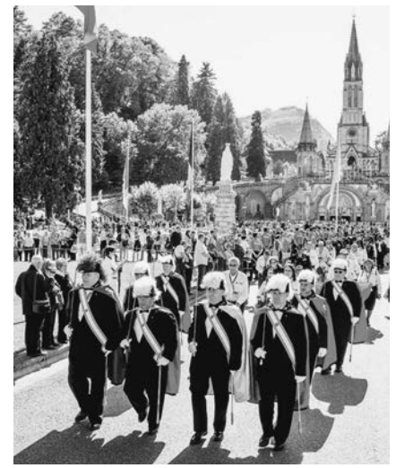
Militares y una guardia de honor de los Caballeros de Colón participaron en una procesión eucarística en Lourdes, el viernes 16 de mayo de 2014.

En ese tiempo, los Caballeros estuvieron activos sirviendo a las tropas estadounidenses en casa y en el exterior por medio del programa de la organización “Army Hut” (Albergue del Ejército), que proveía centros de descanso para las tropas de Estados Unidos y Europa y que sirvió como un preludio de las Organizaciones de Servicio Unidas (USO, por sus siglas en inglés). Bajo el lema “Everybody Welcome, Everything Free” (Todos son Bienvenidos, Todo es Gratis), los Caballeros proveyeron centros en muchos países como Francia, Alemania, Italia, Bélgica, Inglaterra y Estados Unidos. Durante la guerra e inmediatamente después de la Primera Guerra Mundial, los Caballeros también administraron un centro en Lourdes y ayudaron a los soldados estadounidenses en Francia con peregrinaciones al santuario. En ese tiempo, los Caballeros también produjeron un libro de guía de Lourdes para ayudar a los peregrinos estadounidenses.