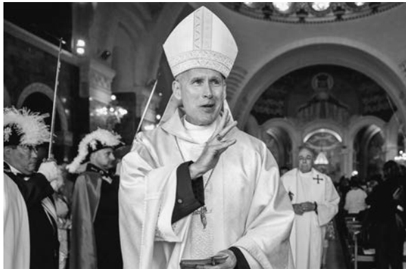
El obispo F. Richard Spencer dando la bendición al salir en procesión de la iglesia.