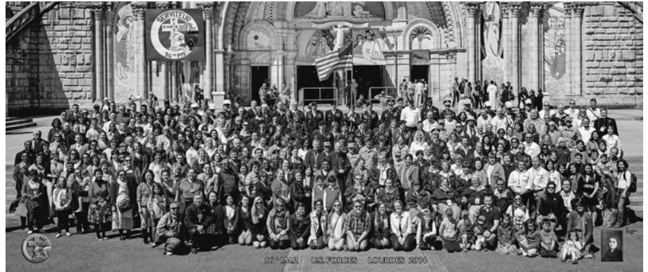
Más de 125 soldados y ex combatientes heridos o discapacitados, familiares, capellanes y personal de apoyo asistieron a la peregrinación al santuario mariano de Lourdes, Francia.