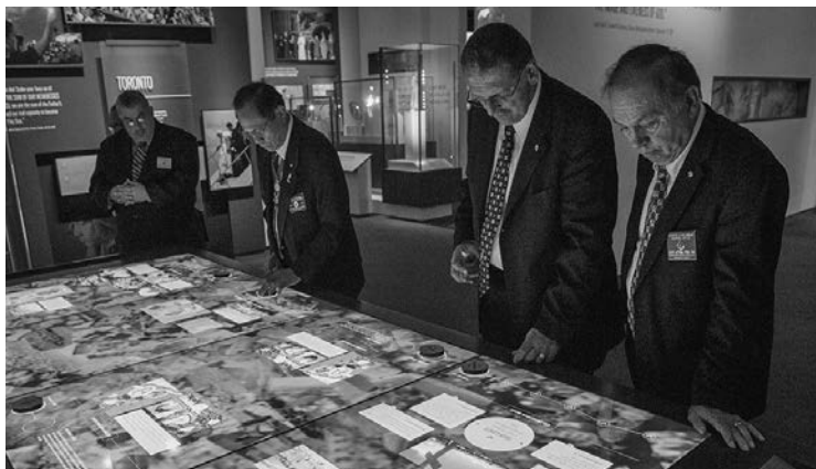
Después de los talleres de la tarde, los diputados de estado recorrieron la exhibición de multimedia de comunicación expuesta en el Santuario Nacional San Juan Pablo II.