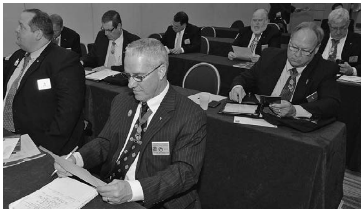
Los participantes de la reunión asistieron a un taller acerca de los Consejos Estrella.

La presentación de la Carta Constitutiva se llevó a cabo en la parroquia St. Augustine, conocida como la “iglesia madre de los católicos afroamericanos, que viven en la capital de la nación”.