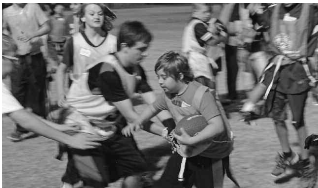
Además de la reunión con los jugadores profesionales de fútbol americano, los atletas de las Olimpiadas Especiales también participaron en un juego de fútbol americano de bandera.

Luke Willson, de los Seahawks, experimentó personalmente la alegría de los atletas de las Olimpiadas Especiales, durante una clínica de fútbol americano y un juego de fútbol americano de bandera en el Parque Nozomi de Chandler, Arizona, patrocinados por los Caballeros de Colón de Arizona, Las Olimpiadas Especiales de Arizona y los Atletas Católicos por Cristo.