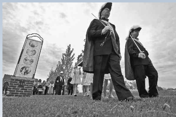
Una Guardia de Honor del Cuarto Grado de Caballeros de Colón lidera una procesión rezando el rosario alrededor del Santuario de Nuestra Señora del Buen Socorro en Champion, WI.

Otros consejos aprovechan el clima cálido para ayudar con el cuidado de jardines y el mantenimiento en sus iglesias o las escuelas parroquiales, muchas veces haciendo que sus parroquias ahorren sumas considerables de dinero, al mismo tiempo que disfrutan la actividad. Algunos ayudan a limpiar parques públicos o se ofrecen como voluntarios para plantar flores en hospitales o en centros de asistencia médica a largo plazo. Algunos consejos han comenzado una huerta de Caballeros de Colón para recaudar dinero para caridades, por medio de la venta de los productos.