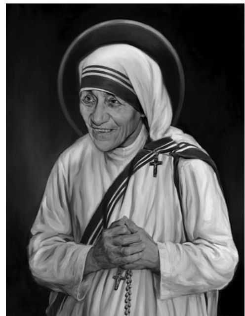
Pintura por Chas Fagan