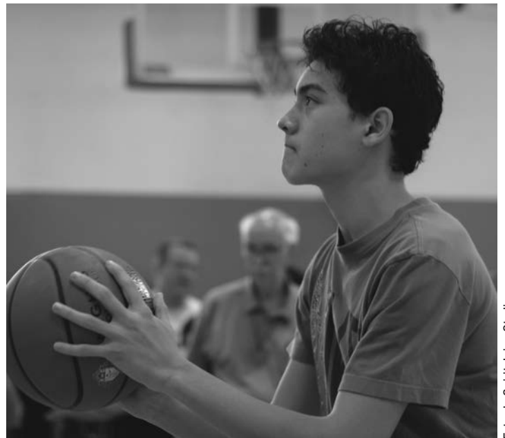
Un joven participante estudia su tiro en el Torneo de Tiros Libres de Caballeros de Colón que organizaron el 14 de enero el Consejo Selma #6856 y el Consejo Good Shepherd #6357 de Schertz, Texas.