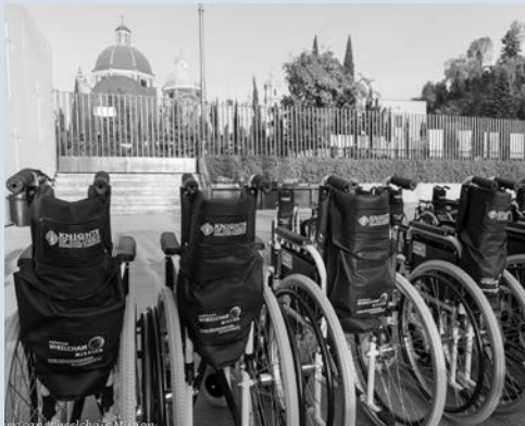
Una fila de sillas de ruedas, justo antes de una distribución en la Ciudad de México, el 22 de febrero de 2016.

La Misión Mundial de Sillas de Ruedas, una asociación de la Misión Estadounidense de Sillas de Ruedas y la Fundación Canadiense de Sillas Ruedas, cambia la vida de niños y adultos cada día.