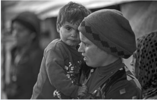
Una joven madre siria, que fue desplazada por la violencia, sostiene a su hijo de 2 años de edad, afuera de su tienda de campaña en un asentamiento informal en Deir al-Ahmar, en el Valle de Bekaa de Líbano.

Los Caballeros de Colón recientemente contribuyeron con casi $2 millones de dólares para diversos programas de ayuda en el Medio Oriente, que han recibido poca o ninguna ayuda del gobierno de Estados Unidos o de la comunidad internacional, desde que ISIS comenzó su campaña genocida contra las minorías religiosas de la región en 2014.