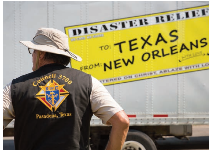
Un Caballero del Consejo Msgr. A.L. O'Connell #3700, de Pasadena, Texas, está en frente de un camión de carga que llevó alimentos y otros suministros para las víctimas del huracán. El consejo ayudó a descargar el camión, que traía suministros de auxilio desde New Orleans.

Si desea apoyar a la labor de nuestros hermanos Caballeros, por favor, visitar kofc.org/disaster o llamar al teléfono 800-694-5713.