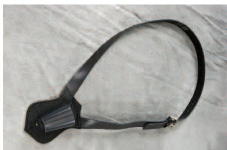
Harnais du porte drapeau