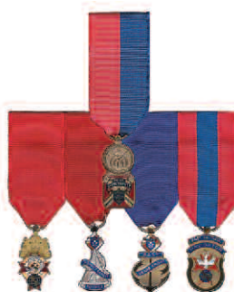
Diagramme 5 Ancien vice-maître suprême Ancien maître Ancien député de district Ex-grand chevalier Ex-fidèle navigateur