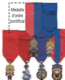
Diagramme 7 Médaille d'ordre pontificaux Ex-député d'état Ancien vice-maître suprême Ancien maître Ancien député de district Ex-grand chevalier Ex-fidèle navigateur