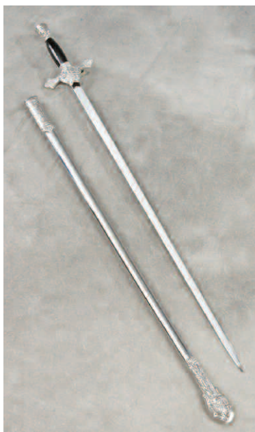
Épée à manche noir et fourreau