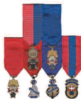
Diagramme 6 Ex-député d'état Ancien vice-maître suprême Ancien maître Ancien député de district Ex-grand chevalier Ex-fidèle navigateur