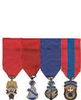
Diagramme 4 Ancien maître Ancien député de district Ex-grand chevalier Ex-fidèle navigateur