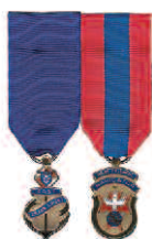
Diagramme 2 Ex-grand chevalier Ex-fidèle navigateur