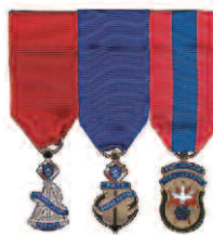
Diagramme 3 Ancien député de district Ex-grand chevalier Ex-fidèle navigateur