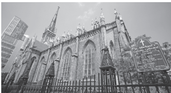
La cathédrale Saint-Michel est l'église-cathédrale de l'archidiocèse catholique romain de Toronto et l'une des plus anciennes églises de la ville. Elle est située dans le quartier « Garden District » (jardin) de Toronto, à quelques rues seulement du lieu où s'est tenue le 134 e congrès.

Des renseignements sur les préparatifs du 134 e Congrès suprême, la Réunion des aumôniers, le Banquet des États et le Discours du Chevalier suprême figureront de jour en jour dans le site kofc.org. Première source d'information privilégiée, à la fois pendant et après le Congrès, la page Web affichera les actualités, des photos et des liens vers des vidéos en direct ou archivées.