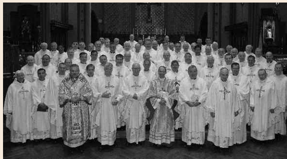
La première rencontre des Aumôniers d'État se déroulait à New Haven où se rassemblent des aumôniers — parmi lesquels on retrouvait cinq évêques — représentant 58 juridictions.