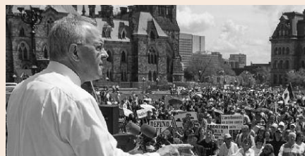
Le Chevalier suprême s'est adressé aux dizaines de milliers de participants qui se sont rassemblés à Ottawa, le 9 mai, à l'occasion de la 16e édition de la Marche nationale pour la vie du Canada.

Rassemblés sur la pelouse devant le Parlement canadien, des citoyens de partout au pays ont pris part au rassemblement qui marquait le coup d'envoi de la Marche et durant lequel plusieurs