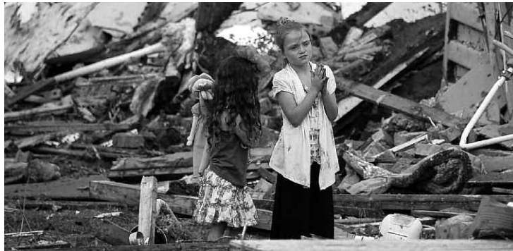
Des personnes évaluent l'ampleur des dégâts à l'hôpital de Moore, en Oklahoma, après avoir été frappés par une tornade ayant causé la destruction des édifices et renversé des voitures dans la ville, le 20 mai. La tornade a touché le sol à l'extérieur de la ville d'Oklahoma City, laissant derrière elle une zone sinistrée d'une étendue de plus de 32 kilomètres ainsi que plusieurs victimes ayant perdu la vie.

Les dons peuvent également être acheminés par la poste à l'adresse