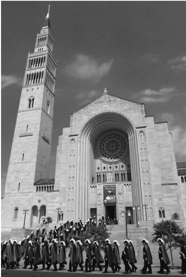
La garde d'honneur entoure le Sanctuaire national pour la procession d'entrée dans le cadre de « L'Année de la foi » à l'occasion des célébrations du 50 e anniversaire de la tour du carillon des Chevaliers.