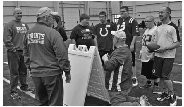
Des athlètes des Olympiques spéciaux sont attentifs aux instructions prodiguées pour un exercice.