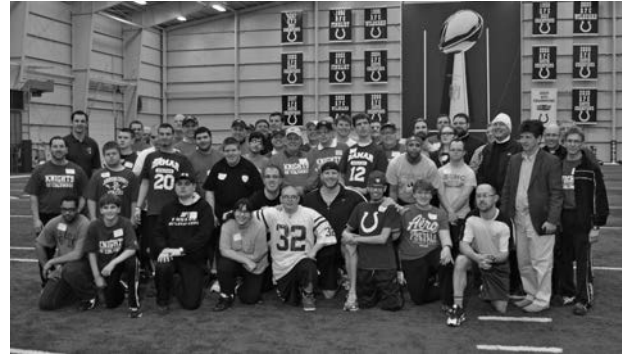
Des participants et des bénévoles de la démonstration d'habiletés posent ensemble.