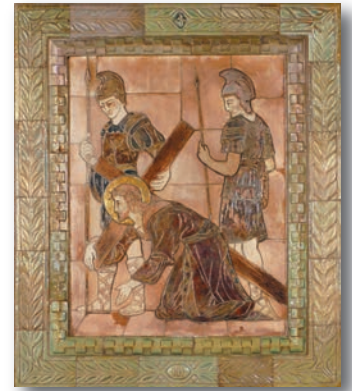
« Jésus tombe pour la première fois », exposé au Sanctuaire national de l'Immaculée Conception de Washington, D.C. L'image de la station figure dans le livret SIC « Le Chemin de croix » (N°363).