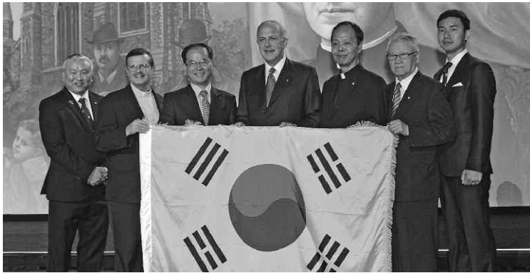
Le Chevalier suprême avec des membres de la Corée du Sud.

« On compte près de 5,5 millions de catholiques en Corée du Sud actuellement. Il s'agit de la communauté catholique connaissant la plus importante croissance au monde, a dit M. Anderson. Je suis persuadé que la Corée du Sud, tout comme les Philippines, jouera un rôle important dans l'avenir des Chevaliers de Colomb. »