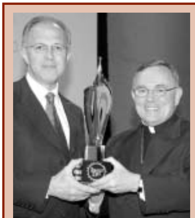
Charles J. Chaput, OFM Cap, archevêque de Denver, félicite le Chevalier Suprême Carl A. Anderson lors du banquet du Prix Imago Dei . L'archidiocèse décerne le prix à une personne qui fait avancer la cause de la foi et de la religion à travers le monde.

Redemptoris Mater Archdiocesan Missionary Seminary. Beaucoup de Chevaliers du Colorado et leurs con-