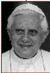
pape Benoît XVI

Les rencontres du samedi furent consacrées à ce que le Chevalier