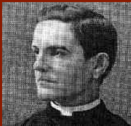
Le vénérable serviteur de Dieu, l'abbé Michael J. McGivney

La cause de la canonisation a été inaugurée il y a plus de 10 ans. Un miracle a été rapporté au Vatican pour exam-