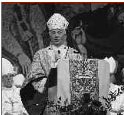
3 Le cardinal Marc Ouellet, archevêque de Québec, primat du Canada, prononçant l'homélie à l'Eucharistie d'ouverture du Congrès suprême, le 5 août.

- Le nombre d'Écuyers colombiens s'est accru pour atteindre 18 961 membres, et on note que les Chevaliers universitaires sont maintenant 20 7568, soit une augmentation de 1301 depuis l'an dernier.