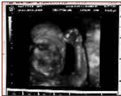
Grâce à la technologie avancée, l'écographie tridimensionnelle produit l'image d'un bébé à 23 semaines

L'appui des Chevaliers a été capital pour ces deux centres, qui n'auraient pu autrement acheter ces appareils sophistiqués coûtant des dizaines de milliers de dollars chacun. Le 23 janvier, le Women's Help Center Inc. de Jacksonville, en