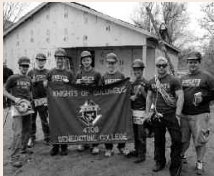
Dix membres du Conseil universitaire 4708 de St. Benedict's College, d'Atchison, au Kansas, ont collaboré avec d'autres bénévoles pour la réalisation d'un projet d'Habitat pour l'humanité, à Saint-Joseph dans le Missouri, en vue d'effectuer la pose des bardeaux sur la couverture et de monter des murs de contre-plaqués.

« H abitat pour l'humanité » cherche à éliminer la pauvreté et le manque de gîte, une famille à la fois. L'organisation aide les familles dans le besoin à obtenir une maison bien faite et abordable en impliquant la collaboration du futur propriétaire avec les volontaires et les fournisseurs de la communauté pour construire ou rénover la maison. Les entreprises de construction d' « Habitat pour l'humanité » fournissent d'excellentes occasions de manifester à des membres éventuels de quel bois se chauffent les Chevaliers de Colomb. Les étapes à suivre pour participer à « Habitat pour l'humanité » comprennent les étapes suivantes :