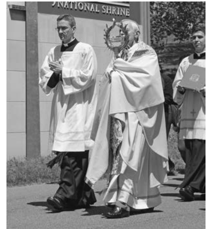
Le cardinal Wuerl bénit la foule avec la relique de saint Jean-Paul II.