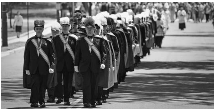
Des Chevaliers membres du Quatrième degré se trouvaient en tête de la procession de la Basilique du Sanctuaire national de l'Immaculée-Conception, à la conclusion de la messe célébrée le 11 mai 2014.

Une fois la procession arrivée au Sanctuaire national Saint Jean-Paul II, le Nonce apostolique aux États-Unis, Mgr Carlo Maria Viganò, procéda à la lecture d'un message papal saluant le travail du sanctuaire. Dans ses remarques, le Chevalier suprême Carl Anderson cita les paroles prononcées par le pape François lors de la canonisation récente durant laquelle le Saint-Père citait lui-même ce que formulait le pape Benoît XVI au moment de la béatification de saint Jean-Paul II : Voir « pèlerins », Page 5