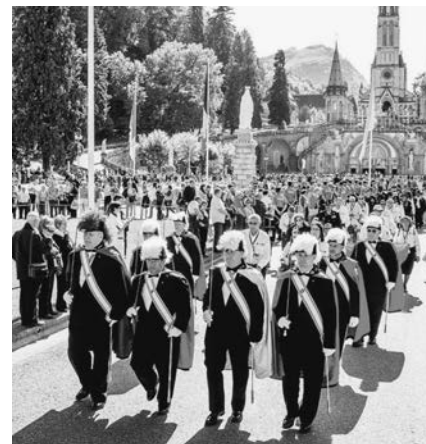
Des membres des Forces armées et de la garde d'honneur des Chevaliers de Colomb ont participé à la procession eucharistique à Lourdes, vendredi le 16 mai 2014.

À l'époque, les Chevaliers étaient actifs au niveau de l'appui apporté aux troupes, et ce, autant au pays qu'à l'étranger, par l'entremise du programme des « huttes militaires » de l'Ordre, qui procurait des centres d'hospitalité pour les membres des Forces armées en service au pays et en Europe. Ce programme était le précurseur de l'entité United Service Organizations (USO). Sous la bannière « Bienvenue à tous, tout est gratuit », les Chevaliers ont mis sur pied des centres dans un certain nombre de pays, dont la France, l'Allemagne, l'Italie, la Belgique, le Royaume-Uni et les États-Unis. Pendant et immédiatement après la Première Guerre mondiale, les Chevaliers ont également administré un centre à Lourdes, tout en prêtant assistance aux militaires américains en poste en France par l'organisation de pèlerinage au sanctuaire. À l'époque, les Chevaliers avaient également publié un guide pour assister les pèlerins américains séjournant à Lourdes.