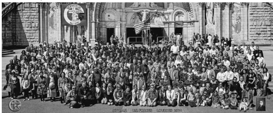
Plus de 125 membres blessés ou handicapés des Forces armées ainsi que des anciens combattants, des membres des familles, des aumôniers et des membres du personnel de soutien ont participé au pèlerinage au Sanctuaire marial de Lourdes, en France. (Photo avec l'aimable autorisation de Lacaze)

(Photo avec l'aimable autorisation de Lacaze)