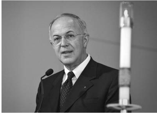
Le Chevalier suprême Carl Anderson a prononcé un discours au cours duquel il cita le pape François lors de la récente canonisation, alors le Saint-Père répétait les paroles du pape Benoît XVI lors de la béatification de Jean-Paul II.

Les cérémonies de la journée étaient télédiffusées internationalement sur les chaînes EWTN, Sel + Lumière, la Catholic Television de Boston, la New Evangelization Television de Brooklyn ainsi que Telecare de Rockville Center.