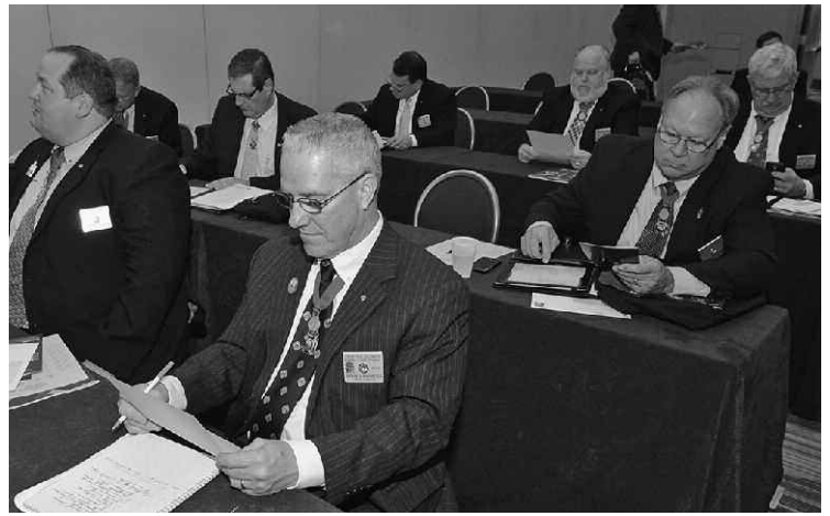
Les participants à la rencontre ont assisté à un atelier sur les Conseils Étoiles.

Samedi, le Chevalier suprême a pris la parole de nouveau : « La vaste majorité des hommes qui sont membres des Chevaliers de Colomb ont été recrutés par un membre de la famille ou un ami, a dit le Chevalier suprême. Et la vaste majorité ont affirmé qu'il ne leur arrive jamais ou très rarement d'inviter quelqu'un à se joindre aux rangs des Chevaliers de Colomb. Il faut que cela change et le message doit venir de vous (les dirigeants des États), et ce, de manière répétitive. Demandez à un ami de se joindre à nous. Demandez à un catholique que vous connaissez de faire de même, voilà la responsabilité qui incombe à la gestion des effectifs. »