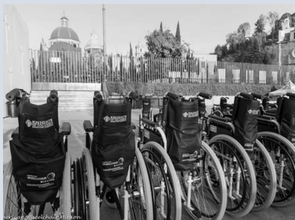
Une rangée de chaises roulantes juste avant leur distribution à Mexico City, 22 février 2016.

La Fondation Chaise Roulante est un partenariat entre la Fondation Chaise Roulante américaine et la Fondation Chaise Roulante canadienne, qui change la vie d'enfants et d'adultes au quotidien.