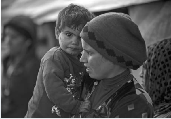
Une jeune mère syrienne déplacée de force tient son enfant de 2 ans à l'entrée de leur tente dans un camp improvisé de Deir al-Ahmar, dans la vallée de la Bekaa, au Liban.

Dernièrement, l'Ordre des Chevaliers de Colomb a versé près de 2 millions de dollars à des programmes humanitaires au Moyen-Orient qui n'avaient reçu aucune aide ou très peu de la part du gouvernement américain ou de la communauté internationale depuis le début de la campagne de Daesh contre les minorités religieuses en 2014.